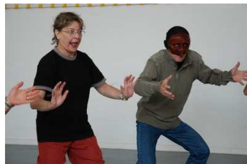
Ateliers de pratique (2 séances de 3 h) pour les élèves. Les enseignants ont leur atelier