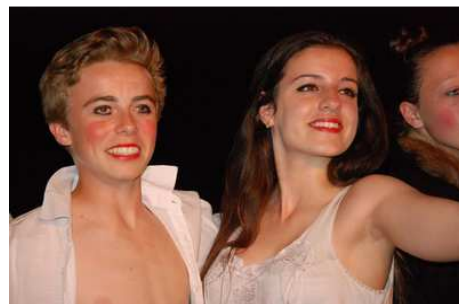
Des spectacles d'élèves de 30' chacun maximum, le fruit du travail d'une année.