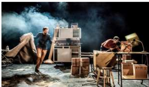
Un spectacle professionnel ouvert au public