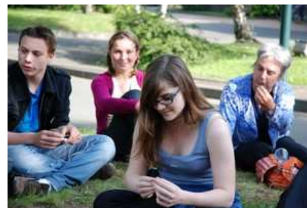
Echanges autour des spectacles. Pas de compétition : mise en valeur des qualités et suggestions constructives