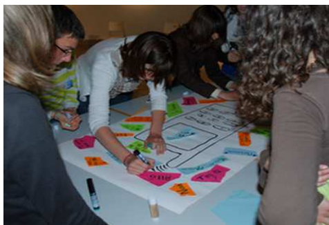
Ateliers facultatifs aux entractes (affiches, lectures...)