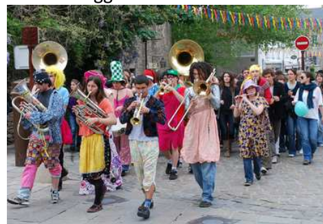
Animation de la ville ( musique, fanfare textuelle, bandes annonces... )